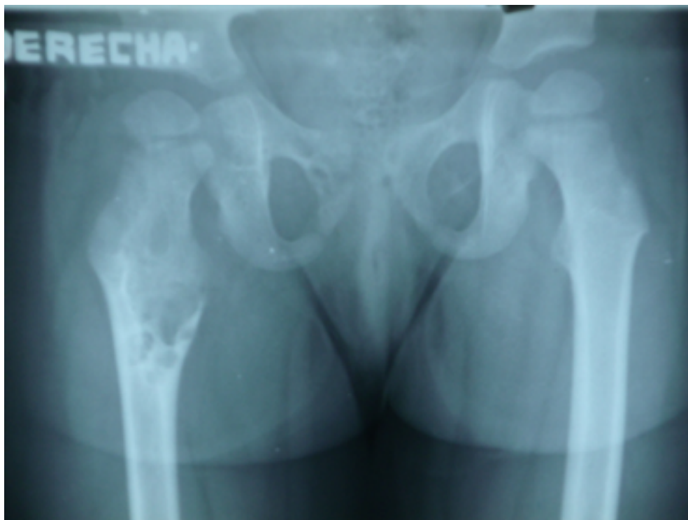
Figura 1. Radiografía anteroposterior de la pelvis ósea donde se observan lesiones osteolíticas, de bordes bien definidos, lobuladas, que adelgazan la cortical en el extremo proximal del fémur derecho.

Impresión diagnóstica: Sinovitis de cadera de causa tumoral