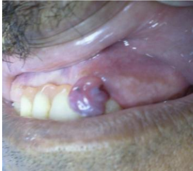
Fig. 2. Tumoración no fija al tejido óseo y de consistencia firme.